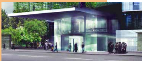
RUE DE LA SANTÉ • CMME-SECTEUR 3

Améliorer le fonctionnement et l'accueil, préparer l'avenir, inscrire mieux le site dans Paris et lui restituer ses qualités historiques sont les objectifs du projet architectural de Sainte-Anne. Pour une cohérence d'ensemble, le Schéma Directeur Immobilier et Architectural est prévu sur une période de 15-20 ans et repose sur la concordance de trois volets : hospitalier, urbain et architectural.